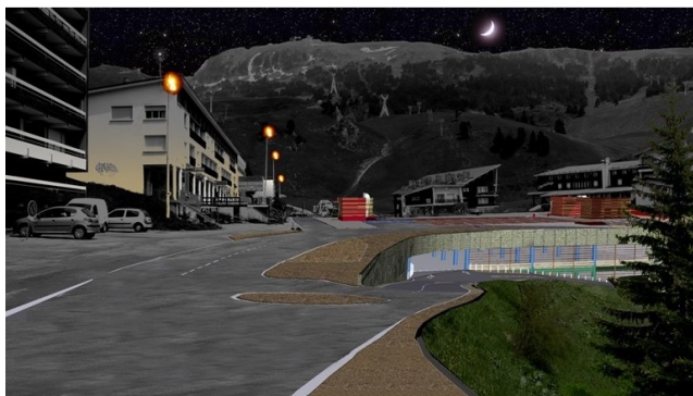
parking à 3 nappes